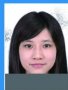
相片损坏 或有污痕