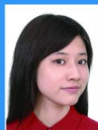
头部侧向一边 或未正视镜头