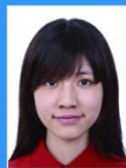
头发遮挡眉毛 眼睛或耳朵