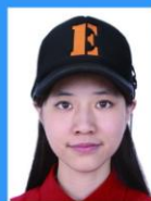
带帽、发饰 遮挡面部、耳朵