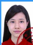
印章或其 他物遮挡人像